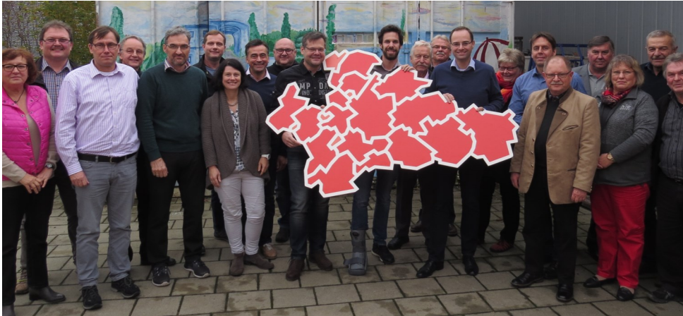
SPD-Kommunalpolitiker aus den ganzen Landkreis

Das Thema sozialer Wohnungsbau möchten die Sozialdemokraten daher zum Gegenstand ihrer nächsten landkreisweiten Klausurtagung machen. ■